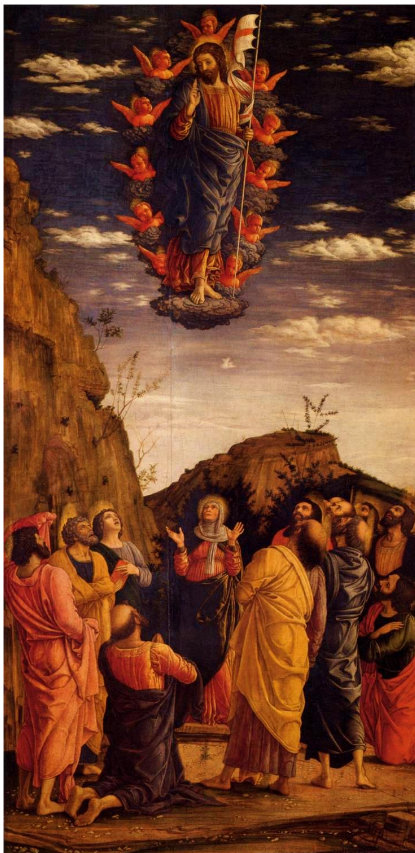
Andrea Mantegna, Ascensione, 1460, Galleria degli Uffizi, Firenze

scavi fu eretto un grandioso tempio al Sacro Cuore, mentre l'edicola rotonda della chiesa di Poemenia, divenne dal secolo XVI una piccola moschea ottagonale.