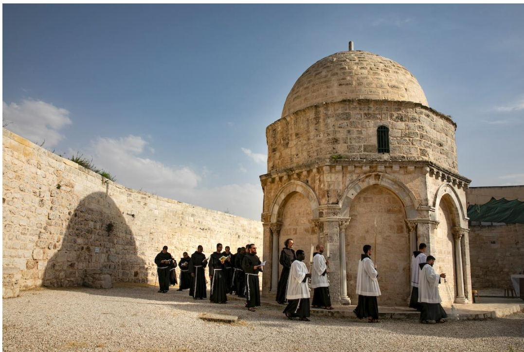
Gerusalemme, Edicola dell'Ascensione

lavoro della redenzione. Più chiari ancora gli Atti, che nominano esplicitamente il monte degli ulivi, poiché dopo l'ascensione i discepoli «ritornarono a Gerusalemme dal monte detto degli Ulivi, che è vicino a Gerusalemme quanto il cammino permesso in un sabato.»(Atti 1:12) La tradizione ha consacrato questo luogo come il Monte dell'Ascensione .